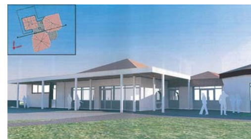
TRAVAUX BATIMENTS Le préau de l'école maternelle,...