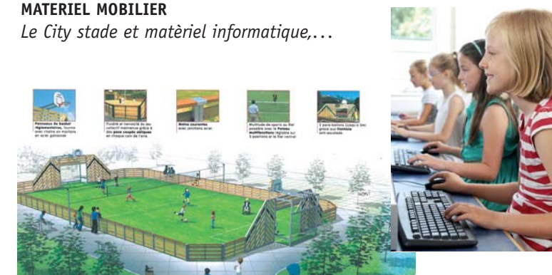
MATERIEL MOBILIER Le City stade et matériel informatique,...