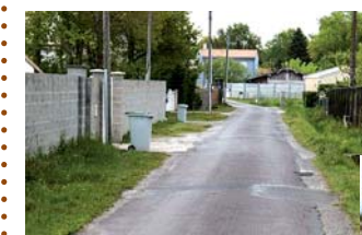
VOIRIES RESEAUX Réfection de la rue du Barail et de l'avenue Jean-Luc Vonderheyden,...