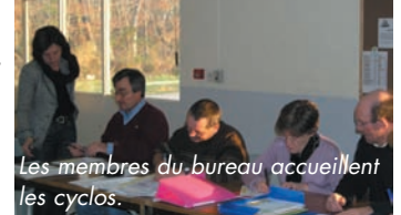
Les membres du bureau accueillent les cyclos.