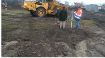
Animation sur le site du Home Médocain.

En cette première semaine de 2005, LES PREMIERS COUPS DE PELLES DU HOME MÉDOCAIN sont donnés sur le site proche du tennis-club. Cette maison de retraite de 55 places devrait être opérationnelle au début de l'automne. Nous y reviendrons plus en détail dans notre numéro de juillet.