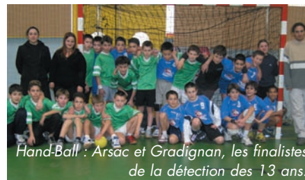
Hand-Ball : Arzac et Gradignan, les finalistes de la détection des 13 ans.

Les instances départementales du HANDBALL réalisent, à Arzac, leur DÉTECTION DES 13 ANS avec la présence de près de 350 jeunes. Cette découverte de