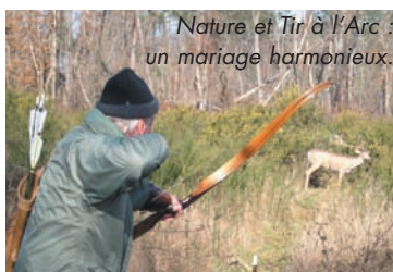
Nature et Tir à l'Arc : un mariage harmonieux.

LE CONCOURS 3D DES ARCHERS ARSACAIS se déroule par un beau temps à Soubeyran et dans sa campagne environnante. Une cinquantaine de sportifs en découpent pour décrocher, la qualification pour les championnats de France, dans une ambiance conviviale.