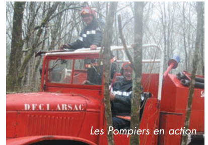
Les Pompiers en action