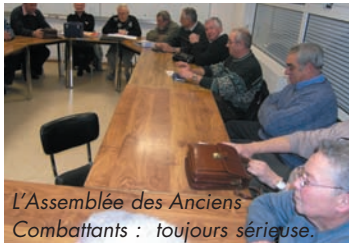
L'Assemblée des Anciens Combattants : toujours sérieuse.

Lafitte livre et captive avec des contes du monde entier.