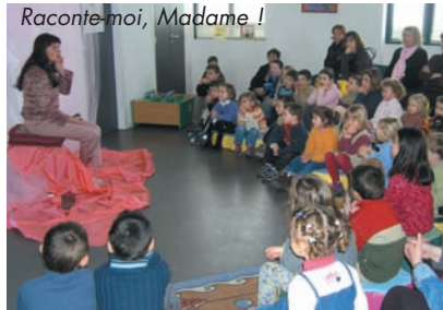
Raconte-moi, Madame !

A LA BIBLIOTHÈQUE, "RENDEZ-VOUS CONTES" , permet, tous les troisième mercredi du mois, de recevoir les enfants de plus de trois ans pour une heure de conte mensuelle. Stéphanie