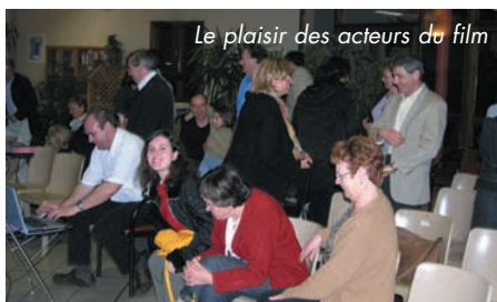
Le plaisir des acteurs du film

LES DIRIGEANTS DU CIA ET DE SCÈNE EN VIGNES se retrouvent à la RPA pour découvrir le film de la première représentation des théâtres Arsacais. Moment sympathique, avec un spectacle à nouveau apprécié et une réalisation fidèle et de qualité.