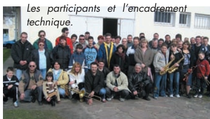
Les participants et l'encadrement technique.

LE STAGE DE FORMATION MUSICALE de la Fédération d'Aquitaine de l'UFF, organisé par la batterie fanfare d'Arsac "Prestige- Margaux", voit la présence de 45 musiciens représentant cinq sociétés et répartis en huit ateliers.