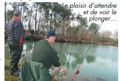
Le plaisir d'attendre et de voir le bouchon plonger...

LA JOURNÉE DE PLEIN AIR du lundi de pâques, organisée par les amis du Sescas avec le soutien du Domaine de Cordet, connaît un vif succès populaire. Soleil, concours