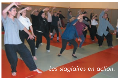
Les stagiaires en action.

Alors que les amis de Sescas font les crêpes pour la chandeleur, le stage de Tai Chi Chuan organisé par la section GV du Haut-Médoc connaît un bon succès avec plus de 45 stagiaires et une bonne ambiance