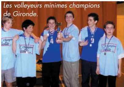
Les volleyeurs minimes champions de Gironde.