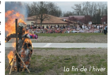
La fin de l'hiver

LES ÉLÈVES DE MATERNELLE FÊTENT LE PRINTEMPS et brûlent l'hiver. C'est, derrière le bonhomme hiver, un joli défilé des enfants costumés sur le thème de la mode et de l'art qui accompagne la sinistre saison vers le bûcher. De nombreux parents participent à la joie des enfants applaudissant la fin de l'hiver avant la collation de tous pour fêter l'événement.