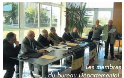
Les membres du bureau Départemental.