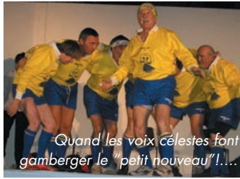
Quand les voix célestes font gamberger le "petit nouveau" !...

Les Rugbymen de l'US Arzac-Football ont ouvert leurs vestiaires et l'on ne s'est pas ennuyé avec ces équipes de trinquette taille qui ont gagné leur match. Sur le terrain et avec un public fort satisfait de cette dynamique troupe d'amateurs.