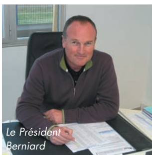
Le Président Bernard

Ils seront plus de 3500 sportifs à s'élancer sur les parcours de LA MEDOCAINE DE VTT.