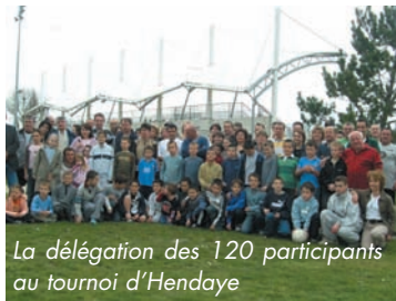
La délégation des 120 participants au tournoi d'Hendaye

Alors qu'en fin février, LES CYCLOS ARSACAIS sont partis avec leurs amis de Capeyron, en randonnée dans le vignoble médocain, en ce week-end Pascal, LES POUSSINS DE L'ENTENTE ARSAC-LE PIAN , avec parents et dirigeants, s'en vont disputer le tournoi d'Hendaye des jeunes footballeurs. Foot, famille et détente se marient harmonieusement pendant trois jours.