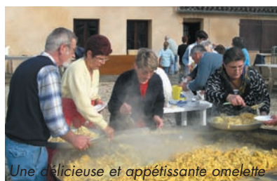
Une délicieuse et appétissante omelette

de pêche, omelette géante, jeux divers, kermesse et animations contribuent au réel bonheur des acteurs de cette manifestation qui prend place, désormais, dans le calendrier festif médocain.