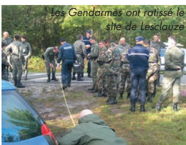
Les Gendarmes ont ratissé le site de Lesclauze

LA DECOUVERTE DU CORPS DE DANIEL VIGNOLLES mort dans sa voiture retrouvée à Lesclauze laisse la commune dans une profonde stupeur. Cet Arsacais de toujours, discret et sans histoire, comptait de nombreux amis dans la commune. Gendarmes et policiers s'évertuent à découvrir les raisons de cette mort.