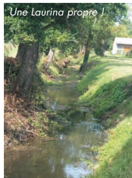
Une Laurina propre !

Profitant des basses eaux, les employés municipaux