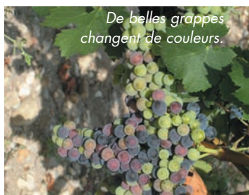
De belles grappes changent de couleurs.

Le CLSH et plage en bus continuent à mobiliser les jeunes. En ce début du mois, la VÉRAISON modifie les couleurs des fruits du vignoble, annonçant des vendanges vers le 20 septembre.