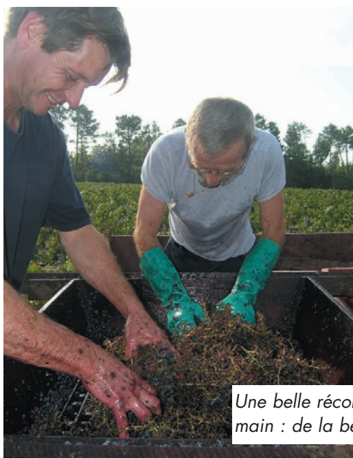
Une belle récolte déraflée à la main : de la bel ouvrage