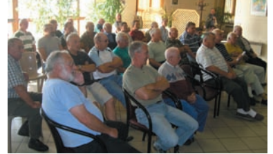
L'assistance lors de l'AG des chasseurs.