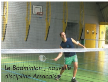
Le Badminton, nouvelle discipline Arsacaise.

La rentrée scolaire se déroule dans la quiétude et la sérénité.