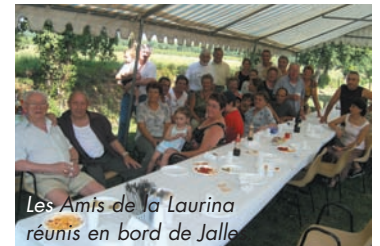
Les Amis de la Laurina réunis en bord de Jalle

donnent l'occasion d'échanges conviviaux et de maintenir des liens de bon voisinage. L'ambiance fait plaisir à tous !