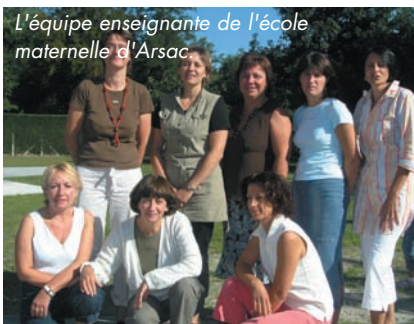
L'équipe enseignante de l'école maternelle d'Arsac

Effervescence, en ce matin estival dans la belle cour de la maternelle avec la rentrée des 128 petits inscrits (contre 132 l'an passé) parmi lesquels les nouveaux s'intégraient avec une réelle facilité dans les cinq classes maintenues ; trois nouveaux élèves étant attendus dans les prochains jours. A cette stabilité des effectifs s'ajoute celle des enseignantes avec un seul départ, celui de C. Tafary compensé par l'arrivée de M. Duclos. Ainsi donc, et complétée par l'aide de quatre ATSEM (agent technique spécialisé dans l'école maternelle), l'équipe pédagogique met en place les projets pédagogiques et d'animations, en étroite collaboration avec la Bibliothèque pour certains et avec la perspective d'expositions en fin d'année scolaire. Enfin, idée originale, l'Ecole des vendanges chez un propriétaire local devrait, dans les semaines qui viennent, donner l'occasion aux petits de découvrir un monde nouveau pour eux !