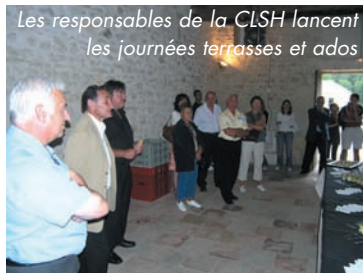
Les responsables de la CLSH lancent les journées terrasses et ados

LE CLSH, durant tout le mois, accueille de nombreux jeunes (une cinquantaine par jour) alors que l'opération PLAGE EN BUS , conduit à Lacanau de nombreux jeunes ados qui sont également sensibilisés par