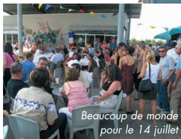
Beaucoup de monde pour le 14 juillet