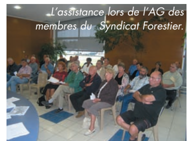
L'assistance lors de l'AG des membres du Syndicat Forestier.

Lors de son Assemblée Générale, L'ASLF (ASSOCIATION SYNDICALE LIBRE ET FORESTIERE) D'ARSAC , confirme que pour la seconde étape de nettoyage de la forêt prévue pour 2007 concernera 780 ha de forêt Arsacaise. Avec les 200 ha de la 1ère étape en cours de réalisation, cela conduira à près de 1000 ha reboisés.