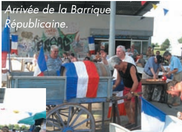
Arrivée de la Barrique Républicaine.

C'est sous la chaleur caniculaire que se déroulent LES FESTIVITES DU 14 JUILLET , sur le site de Soubeyran, avec pique-nique Républicain, barrique, vin et fromage, prestation de prestige Margaux, bal populaire et feu d'artifice dans une belle ambiance.