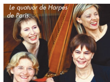
Le quatuor de Harpes de Paris.

THE DANSANT A LA RPA ET CONCERT DU QUATUOR DE HARPES DE PARIS en l'église ST GERMAIN permettent de vivre le premier jour d'octobre dans des ambiances musicales fort sympathiques.