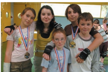
Les 5 jeunes Rollers qui ont brillé aux championnats de France

LES JEUNES ROLLERS ARSACAI s décrochent trois médailles lors des championnats de France de leurs catégories.