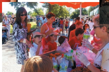
Belle ambiance à la Kermesse de l' APEA