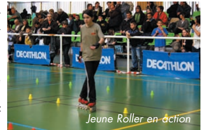
Jeune Roller en action