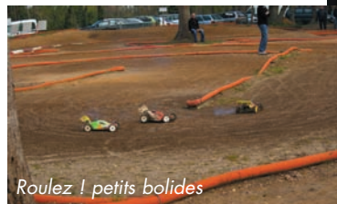
Roulez ! petits bolides

LES FIDÈLES PLANTENT LES MAIS chez les élus et sont les invités de M. Le Maire au domaine de Cordet; bien dans la tradition ! Tout comme la FÊTE DES MÈRES chez les Amis de Sescas avant que , le 31 mai, Arzac réaccueille 5800 vététistes (dont nombreux sont les déguisés) pour la 10ÈME ÉDITION DE LA MÉDOCAINE couronnée de succès.