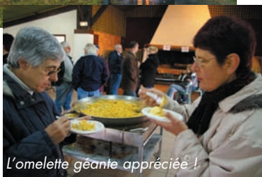
L'omelette géante appréciée !