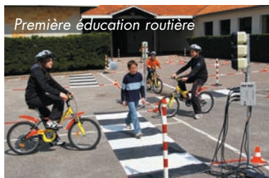
Première éducation routière

En début Avril, l'artiste JOSÉ CORRÉA EST À LA BIBLIOTHÈQUE pour rencontrer, les élèves de l'école primaire et exposer les raisons de son amitié pour les chats. Le même jour, LES MAIRES DU