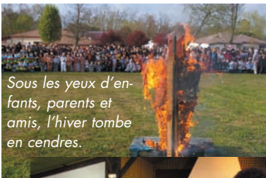
Sous les yeux d'enfants, parents et amis, l'hiver tombe en cendres.

LES FÊTES DU PRINTEMPS sont de réels succès : Celle des anciens des Amis du Sescas, à Cordet, où concours de pêche et omelette géante tiennent la vedette malgré la grisaille du ciel. Celle aussi, des enfants déguisés et personnels de l'école maternelle qui brûlent le bonhomme d'Hiver devant la Mairie sous les yeux des parents et amis venus nombreux