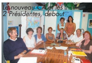
Le nouveau CA et les 2 Présidentes, debout

Dès le lendemain, la découverte du pays Catalan a pu commencer : notre périple a démarré par une dégustation d'huitres de Leucate afin de prendre un bon départ ! Puis visites de Perpignan, la forteresse de Salses, construite au XVème siècle et, bien sûr fortifiée par Vauban au XVIIème, la côte Vermeille, Collioure avec parcours "épique" en petit train qui nous a emmenés sur les hauteurs de la ville, Port Vendres, L'Espagne jusqu'à Rosas, Villefranche de Conflent, l'Abbaye de St Michel de Cuixa, Carcassonne et au milieu de tout cela, visites de domaines viticoles avec, bien sûr, dégustations.