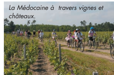
La Médoquine à travers vignes et châteaux.

LES FIDÈLES PLANTENT LES MAIS chez les élus et sont les invités de M. Le Maire au domaine de Cordet; bien dans la tradition ! Tout comme la FÊTE DES MÈRES chez les Amis de Sescas avant que , le 31 mai, Arzac réaccueille 5800 vététistes (dont nombreux sont les déguisés) pour la 10ÈME ÉDITION DE LA MÉDOCAINE couronnée de succès.