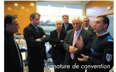
Signature de convention

LE SOUS-PRÉFET OLIVIER DELCAYROU est à Arzac, le 31 janvier, pour signer avec le CdC Médoc-Estuaire, la convention de partenariat liant Police Communautaire et Gendarmerie.