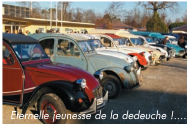
Éternelle jeunesse de la dedeuche !...

LE RASSEMBLEMENT DE GIRONDEUCHES connaît, un joli succès. La présence de très nombreuses 2 cv de toutes époques et de tous styles, leur ballade à travers