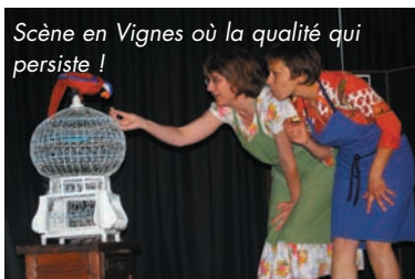
Scène en Vignes où la qualité qui persiste !

En début juin, LE HOME MÉDOCAIN FAIT SES J.O. en y invitant deux maisons de retraite voisines. LE GALA DES