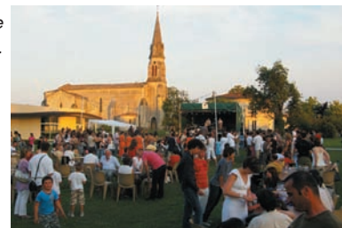
Belle ambiance à la fête de la Musique.

JOLI SUCCÈS POPULAIRE DE LA FÊTE DE LA MUSIQUE , dans