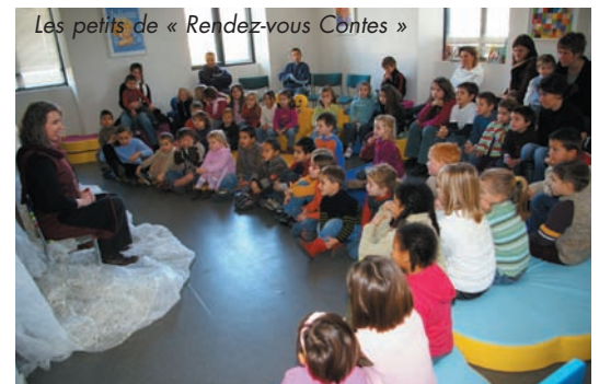
Les petits de « Rendez-vous Contes »

Les BÉBÉS LECTEURS et les PETITS DE « RENDEZ-VOUS CONTES » clôturent leur session automnale de la bibliothèque. Ils sont