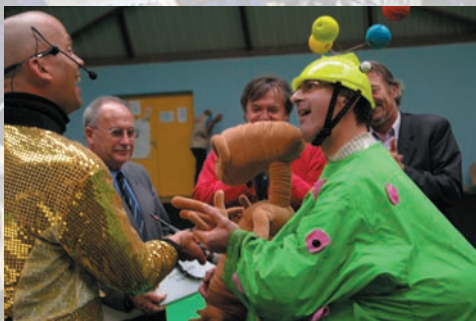
La journée sportive s'achève avec les récompenses et la bonne humeur...