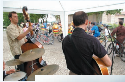
ou réalisent la pause dégustation musicale