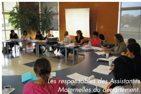
Les responsables des Assistances Maternelles du département.

du département tiennent, en début de mois, l'une de leurs trois réunions annuelles de travail et d'échanges dans une bonne ambiance. Une