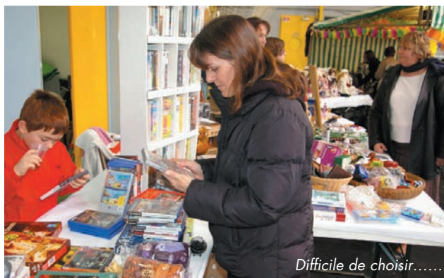
Difficile de choisir.....

Les 24 et 25, salle de Panchon, LE CIA ET BOURSECO FONT BOURSE COMMUNE dans un bric à brac et micro qui voient la présence de nombreux visiteurs qui se montrent satisfaits par une organisation impeccable.