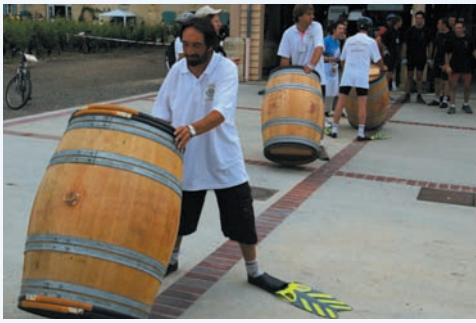
dont certains disputent le Vinathlon