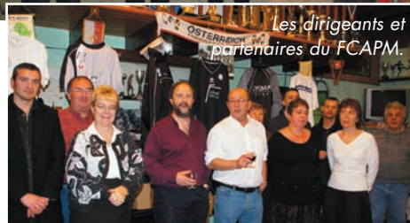
Les dirigeants et partenaires du FCAPM.

En ce début décembre, l' APA a fait un retour sur le succès de ses 15 ème foulées des Vignerons lors d'une soirée à la RPA au cours de laquelle les bénévoles ont été remerciés et les DERNIERS LAURÉATS récompensés. Dans un même temps, le CLUB DE FOOT ACCUEILLAIT SES PARTENAIRES , à la Bergerie, lors d'une sympathique soirée.