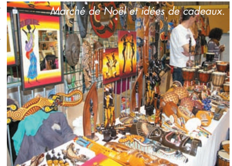
Marché de Noël et idées de cadeaux.

Lors de ce dernier week-end, LE MARCHÉ DE NOËL organisé par la musculation, enregistre, moins d'exposants et davantage de visiteurs que les années précédentes alors que la qualité, fidèle au rendez-vous, est appréciée de tous !