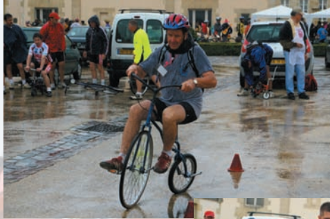
Le Vinathlon se poursuit sous la pluie