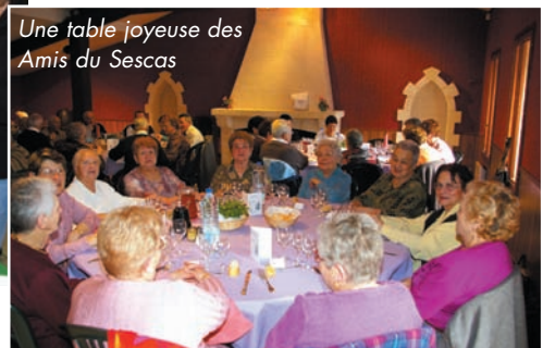
Une table joyeuse des Amis du Sescas