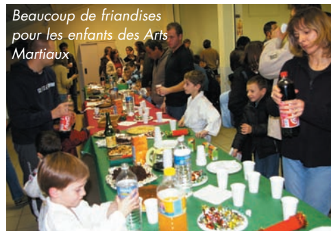
Beaucoup de friandises pour les enfants des Arts Martiaux

Le 08, le LOTO DU HAND connaît un bon succès, salle De Panchon, alors qu'il en est de même, le lendemain, à Cordet, lors du REPAS ANNUEL DES AMIS DU SESCAS qui se déroule dans un excellent climat. Ce même week-end, LE PÈRE NOËL est revenu gâter les enfants des ARTS MARTIAUX .