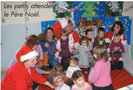
Les petits attendent le Père Noël.

Ce même week-end, LE PÈRE NOËL arrive chez les Assistantes Maternelles et leurs tout petits, salle de Soubeyran, ainsi que chez les parents d'élèves (APEA), salle des Fêtes. L'ambiance festive se met en place.