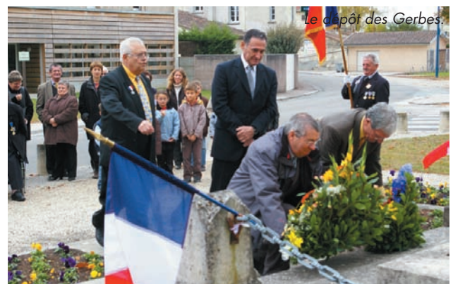
Le dépôt des Gerbes.

LES TRADITIONNELLES CÉRÉMONIES commémoratives du 11 NOVEMBRE sont suivies par un modeste public dans lequel on se réjouit de la présence d'enfants attentifs et intéressés. Honneurs rendus, dépôt de gerbes, vin d'honneur et remises de médailles en sont les points forts.