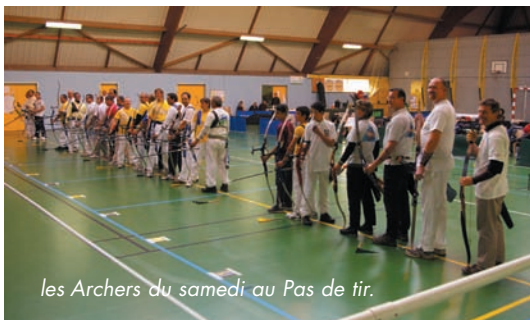
Les Archers du samedi au Pas de tir.