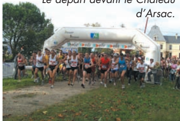
Le départ devant le Château d'Arsac.

LES 14ÈMES FOULÉES DES VIGNERONS dans leur nouvelle formule connaissent un réel succès populaire et sportif avec plus de 750 participants (dont 200 randonneurs), de beaux vainqueurs et de nombreux récompenses.