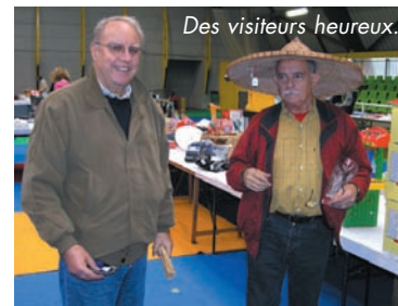
Des visiteurs heureux.

LE BRIC À BRAC ET LA BOURSE INFORMATIQUE du dernier week-end du mois se déroulent à la satisfaction générale, salle de Panchon, avec de nombreux et attentifs visiteurs qui, souvent, ont trouvé ce qu'ils cherchaient.