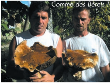
Comme des Béréts !

Après les vendanges, LA CUEILLETTE DES CÈPES abondants cet automne, mobilise les énergies dans les temps de loisir. Il n'est pas de chercheur qui ne trouve pas de quoi faire une jolie poêlée. Car, aux plaisirs de la cueillette, s'ajoutent ceux de la table et du palais !