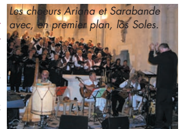
Les chœurs Ariana et Sarabande avec, en premier plan, los Soles.

L'ÉGLISE SAINT-GERMAIN ACCUEILLE LOS SOLES ET LES CHOEURS ARIANA ET SARABANDE pour un concert de qualité, qui, sous la direction de M. René Rey, fait l'unanimité d'un public conquis mais... trop peu nombreux !