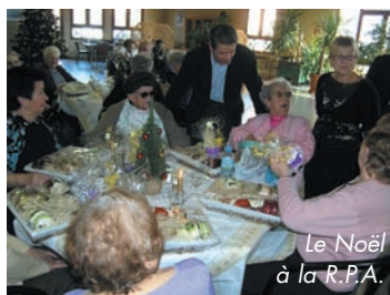
Le Noël des enfants de l'A.P.E.A.

Alors que L'INFORMATION EST DISPENSÉE SUR LE S.P.A.N.C. (service public d'assainissement non collectif) avec réunions et documents spécifiques, L'AVENIR PÉDESTRE (A.P.A.) créé sa section randos, avec de nombreuses adhésions.