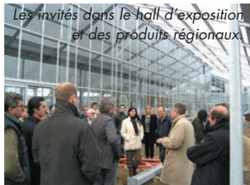
Les invités dans le hall d'exposition et des produits régionaux.

LA WINERY PHILIPPE RAOUX prend belle tournure. C'est ce que peuvent constater, en cette mi-novembre, élus locaux et partenaires viticoles lors d'une visite sur le site et la présentation des actions œnoturistiques dans une chaleureuse ambiance. En attendant l'inauguration de "L'arbre du soleil" (voir par ailleurs).