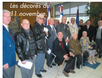
Les décorés du 11 novembre.