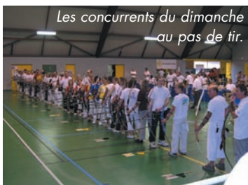
Les concurrents du dimanche au pas de tir.

En ce dernier week-end d'octobre, LE TOURNOI EN SALLE DU TIR À L'ARC, qualificatif pour le championnat de France, connaît un bon succès, avec la présence de 86