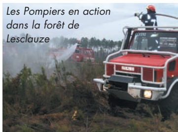
Les Pompiers en action dans la forêt de Lesclauze

Entraînement, avec un incendie fictif en zone Sud de la commune, pour 50 POMPIERS VENUS DE HUIT CENTRES du Sud du Médoc. Placés sous la direction du Capitaine Gilles Lefort, ils effectuent une bonne préparation afin d'être opérationnels dès mars 2007.