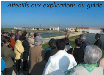
Attentifs aux explications du guide.

LE VOYAGE OFFERT PAR M. LE MAIRE AUX SÉNIORS réunit plus de cent participants. Partis pour une destination inconnue, c'est à Brouage, joli village du patrimoine charentais qu'ils se retrouvent sous le soleil avant l'excellent déjeuner pris à Royan. La visite de cette station et le retour vers le Médoc par le bac, clôturent cette belle journée.