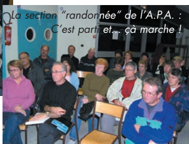
La section "randonnée" de l'A.P.A. : C'est parti et... ça marche !

Alors que L'INFORMATION EST DISPENSÉE SUR LE S.P.A.N.C. (service public d'assainissement non collectif) avec réunions et documents spécifiques, L'AVENIR PÉDESTRE (A.P.A.) créé sa section randos, avec de nombreuses adhésions.