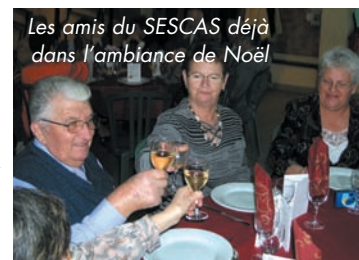
Les amis du SESCAS déjà dans l'ambiance de Noël

LES AMIS DU SESCAS se retrouvent à Cordet pour leur traditionnel repas annuel, dans une ambiance détendue. C'est une même chaleur qui préside aux REMERCIEMENTS DE L'A.P.A. AUX BÉNÉVOLES qui ont contribué au succès des 14èmes foulées des vigneron. Alors que les illuminations de Noël scintillent déjà, l'on sent bien que les fêtes approchent !