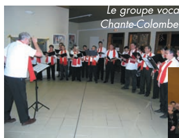
Le groupe vocal Chante-Colombe.