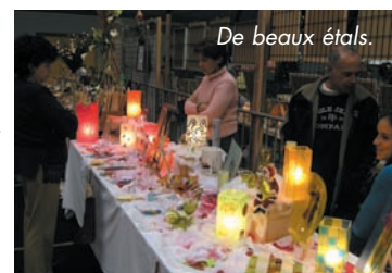
De beaux étals.

LE MARCHÉ DE NOËL , bien organisé, connaît un réel succès avec un grand nombre d'exposants et beaucoup de visiteurs. On recommencera l'an prochain !