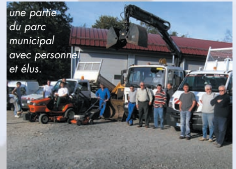
une partie du parc municipal avec personnel et élus.

Après un tracto-pelle en 2001, un camion avec grue et ses annexes en 2003, une tondeuse auto-tractée et du matériel de jardinage en 2005, cette année le parc du matériel municipal s'est enrichi d'un tracteur et de son épaveuse ainsi que, ces derniers jours, d'un camion avec benne pour les jardiniers. Ainsi donc, sans dépenses "pharaoniques", le parc du matériel municipal comprend désormais un tracto-pelle, un camion avec grue, deux camions avec plateau et benne, trois tracteurs et leurs annexes et tondeuses et matériel de jardinage sans oublier deux véhicules légers de service. L'arrivée du matériel neuf était l'occasion d'une manifestation aux ateliers-garages municipaux et réunissant le personnel et les élus. Une réunion au cours de laquelle chacun a pu apprécier la qualité de ce parc permettant un travail apprécié par l'ensemble de la population. C'est ce qu'ont souligné les responsables au cours du Vin d'Honneur clôturant cette visite du 10 novembre dernier.